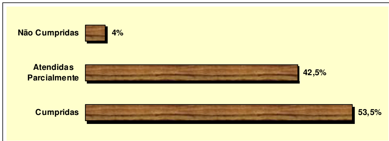
Gráfico 3. Situação das metas do PME, 2012