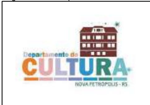
Logomarca do Departamento de Cultura