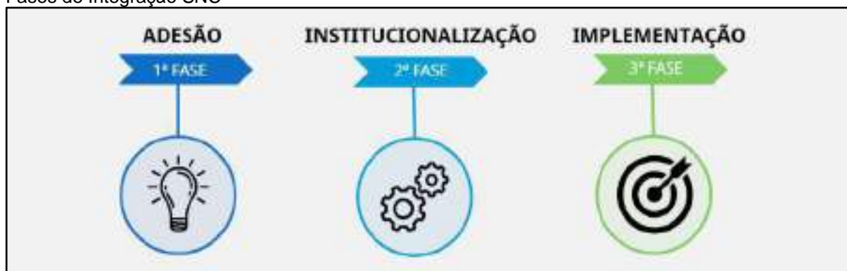
Fases de Integração SNC

A inter-relação entre os componentes é fundamental para serem cumpridas as conexões sistêmicas e a qualificação da gestão pública de cultura.