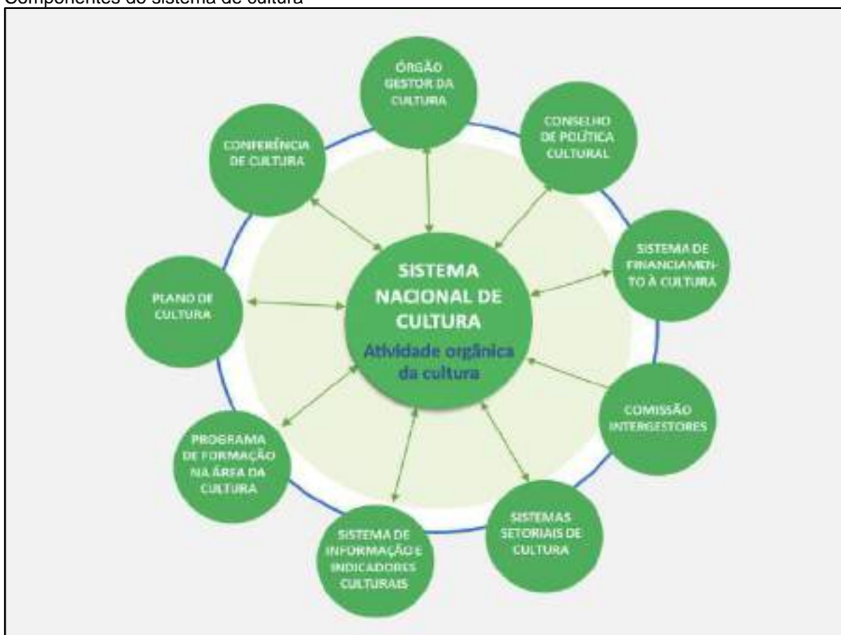
Componentes do sistema de cultura

Os componentes do sistema de cultura, estabelecidos no Artigo 216-A da Constituição Federal, através da Emenda Constitucional Nº 71, de 29 de novembro de 2012, são: órgão gestor, conselho de política cultural, conferência de cultura, plano de cultura, sistema de informação e indicadores culturais, sistema de financiamento à cultura, programa de formação na área da cultura, comissão intergestores e sistemas setoriais de cultura.