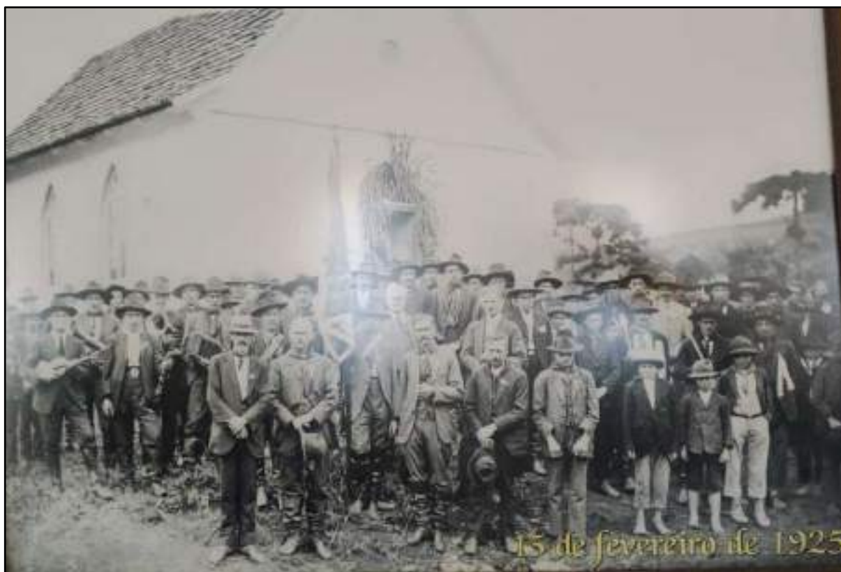
Foto de 1925, exposta na Igreja da Comunidade de Nove Colônias

Uma das primeiras rotas feitas pelos imigrantes para chegar à nova colônia, após a navegação até o "Porto dos Guimarães" (atual São Sebastião do Caí), era o trajeto por "Colônia Feliz", às margens do Rio Caí, dali subiam o morro até Linha Nova ( Neuschneis ) e daí à Linha Olinda*, já na Colônia Nova Petrópolis. Esta rota tinha variantes: de São Sebastião do Caí seguia-se até São José do Hortêncio ( Portugieserschneis ) e de lá até a Linha Nova e Linha Olinda. Grande número de famílias também navegava até São Leopoldo e de lá seguia até Ivoti ( Berghahnerschneis ), continuando de lá até São José do Hortêncio, seguindo via Linha Nova para Linha Olinda, Nova Petrópolis. Outros grupos partiam de "Dois Irmãos" ( Baumschneis ) alguns seguiram rumo ao norte, em busca das "Montanhas Azuis" ( Blaue-Berge des Nordens ) que exerciam grande fascínio sobre os imigrantes. Chegaram ao "Herval" ( Teewald ) e contornando os morros acabaram chegando ao Jammertal e Joaneta, subindo novamente as encostas rumo ao "Pinhal Alto" ( Tannenwald ).