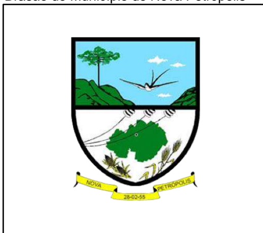
Brasão do Município de Nova Petrópolis

Fonte: Lei Orgânica Nº 116, de 05/04/1958.