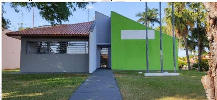
Imagem da Biblioteca, outubro de 2024.

A Biblioteca tem um espaço para reuniões, cursos e uma sala com computadores ligados a internet que é frequentado pela comunidade.