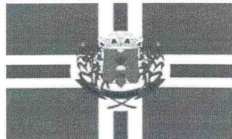
Brasão e Bandeira do Município de Guaraciaba.